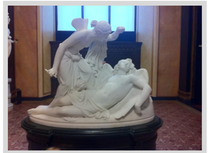
Amor und Psyche | Reinhold Begas | Skulpturensammlung Berlin